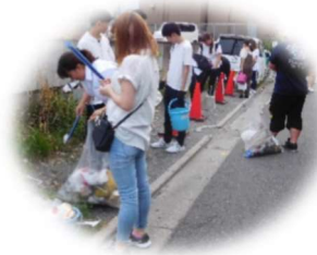
美化ボランティア（7月）