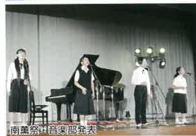
南薫祭・音楽部発表