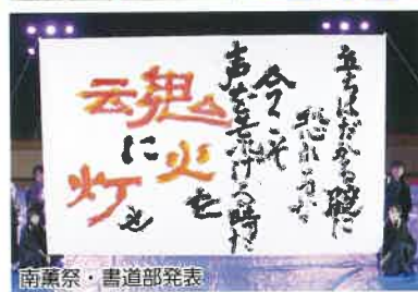
南薫祭・書道部発表