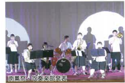
南薫祭・吹奏楽部発表