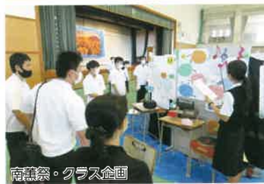
南薫祭・クラス企画