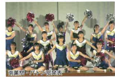
南薫祭・バトン部発表