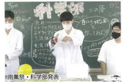
南薫祭・科学部発表