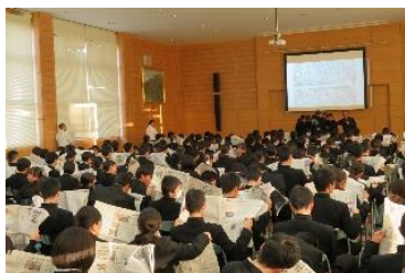
新聞社による連続出前講座

「声」欄に投書する機会を与えて頂いたことが、私に とって1番大きな学びとなっています。有難いことに 新聞に掲載して頂き、私の記事を読んだ方から心を打 たれたとのお手紙が届きました。私自身この経験 は、誇りになっていますし、自身の新たな可能性 に気づくことにもなりました。座学では学ぶこと ができない自身を高められる実技があることが、 この講義の魅力だと思っ ています。