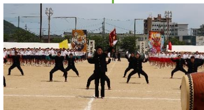
令和4年度体育大会 全校生徒による学校応援